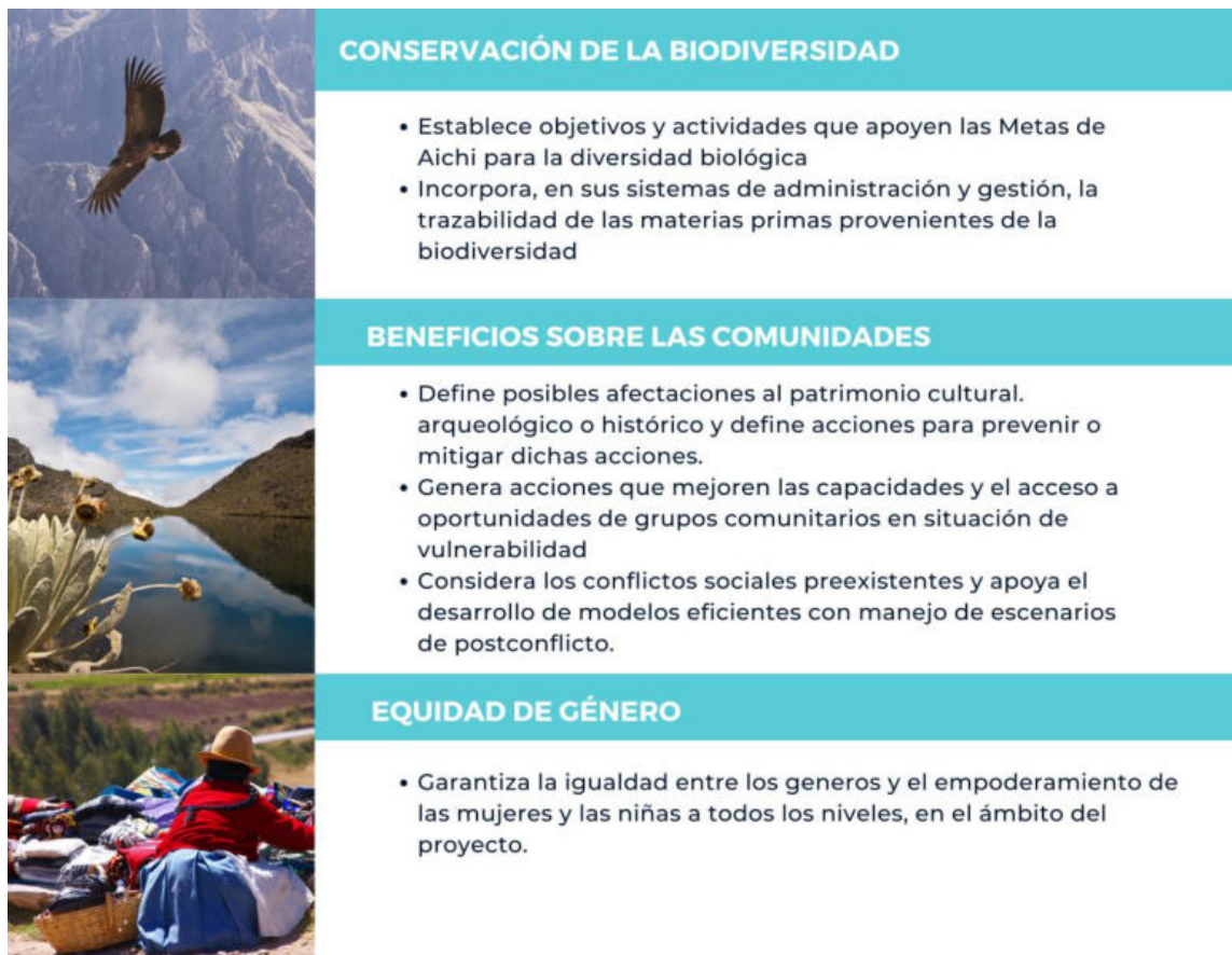
Ilustración 3. Requisitos de la categoría Cóndor andino

población incluyen pérdida de hábitat y envenenamiento secundario. 35 Los requisitos para obtener la Categoría Cóndor andino se presentan en la Ilustración 3.