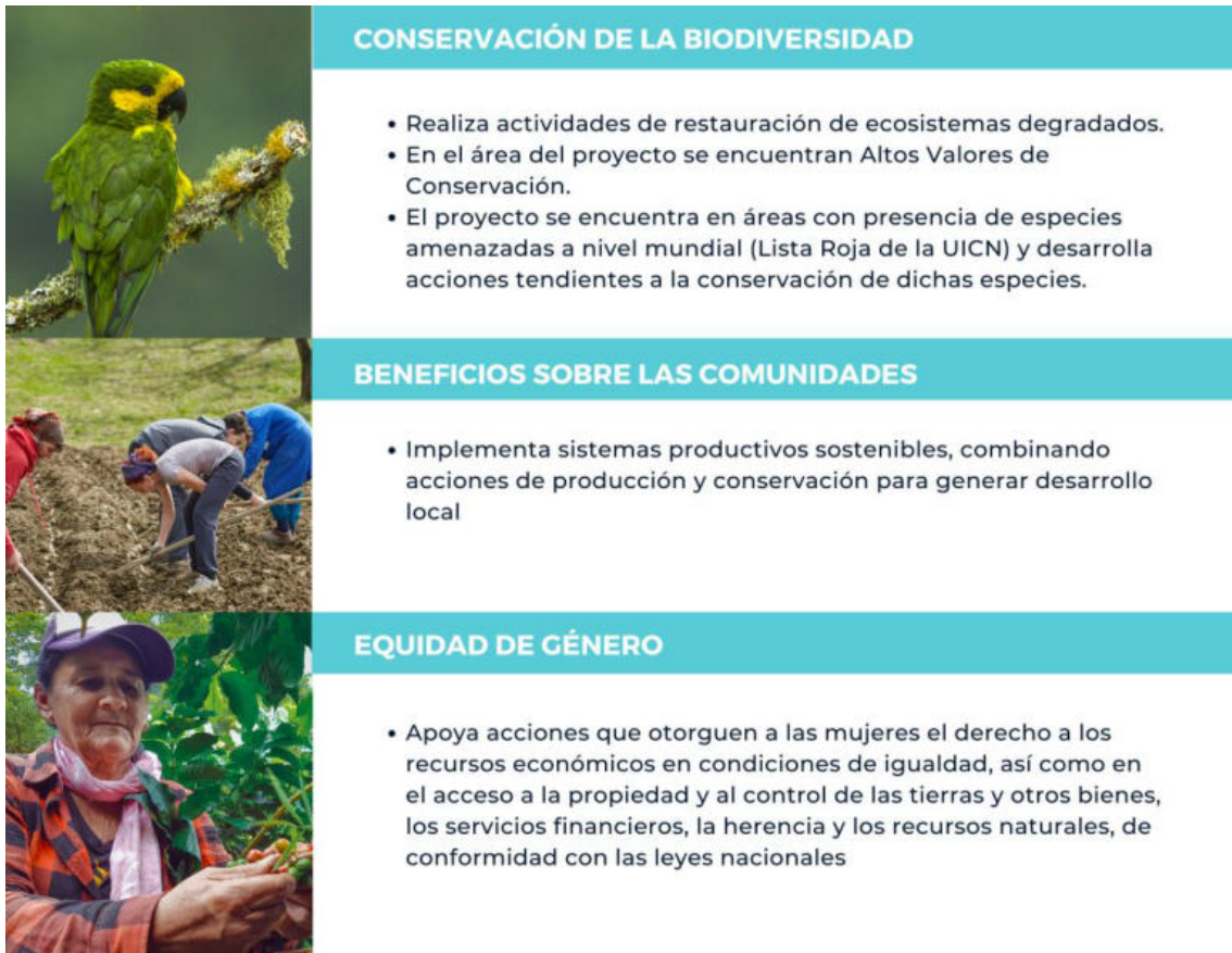
Ilustración 2. Requisitos de la categoría Palma de cera