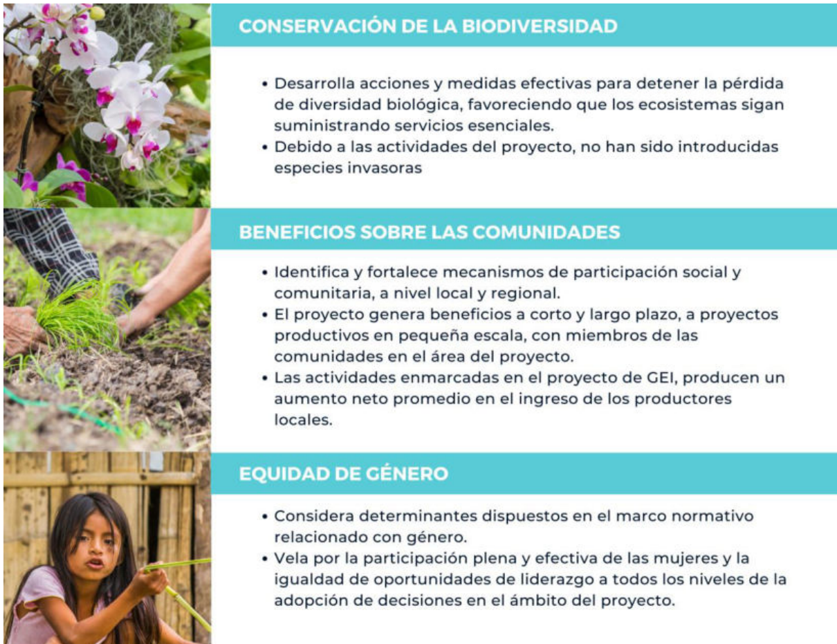
Ilustración 1. Requisitos de la categoría Orquídea