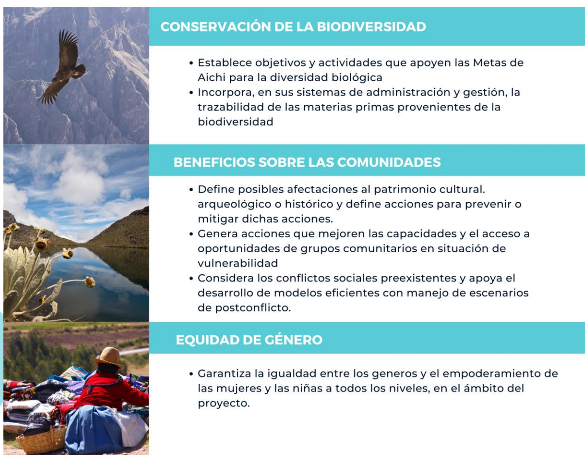
Ilustración 3. Requisitos de la categoría Cóndor andino

aves que vuela a mayores alturas, puede volar utilizando las corrientes térmicas ascendentes verticales de aire cálido y puede alcanzar hasta los 6500 metros de altitud; luego puede planear por cientos de kilómetros casi sin mover las alas extendidas. El cóndor andino se encuentra distribuido a lo largo de la Cordillera de los Andes, desde el sur de la Tierra del Fuego (Argentina y Chile) hasta el occidente de Venezuela. Uno de sus mayores hábitats se encuentra en el Cañón del Colca (Perú). El cóndor andino es considerado una especie casi amenazada por la UICN (Unión Internacional para la Conservación de la Naturaleza), las amenazas a la población incluyen pérdida de hábitat y envenenamiento secundario. 35 Los requisitos para obtener la Categoría Cóndor andino se presentan en la Ilustración 3.