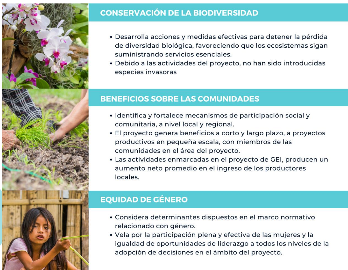
Ilustración 1. Requisitos de la categoría Orquídea

Las orquídeas son el grupo de plantas con flores más diverso y evolucionado del planeta, con cerca de 25.000 a 30.000 especies en el mundo, de las cuales 4.270 son nativas de Colombia y 1.572 son endémicas. Los requisitos para obtener la Categoría Orquídea se presentan en la Ilustración 1.