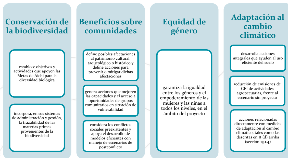
Ilustración 3. Requisitos de la categoría Cóndor andino

El Cóndor de los Andes ( Vultur gryphus ), el mensajero del sol, se considera el ave voladora más grande y pesada que existe en el mundo. 39 Es también una de las aves que vuela a mayores alturas, puede volar utilizando las corrientes térmicas ascendentes verticales de aire cálido y puede alcanzar hasta los 6500 metros de altitud; luego puede planear por cientos de kilómetros casi sin mover las alas extendidas. El cóndor andino se encuentra distribuido a lo largo de la Cordillera de los Andes, desde el sur de la Tierra del Fuego (Argentina y Chile) hasta el occidente de Venezuela. Uno de sus mayores hábitats se encuentra en el Cañón del Colca (Perú). El cóndor andino es considerado una especie casi amenazada por la UICN (Unión Internacional para la Conservación de la Naturaleza), las amenazas a la población incluyen pérdida de hábitat y envenenamiento secundario. 40 Los requisitos para obtener la Categoría Cóndor andino se presentan en la Ilustración 3.