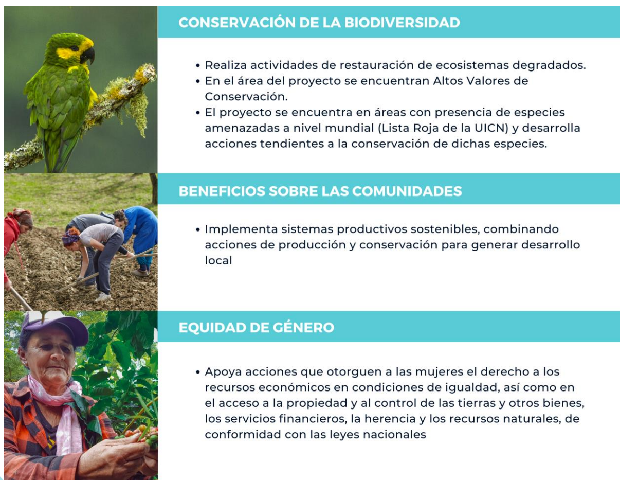
Ilustración 2. Requisitos de la categoría Palma de cera

central, su hábitat se ha reducido considerablemente y se estima que sus poblaciones han disminuido en más del 50% en las últimas tres generaciones (210 años). 33 Los requisitos para obtener la Categoría Palma de cera se presentan en la Ilustración 2.