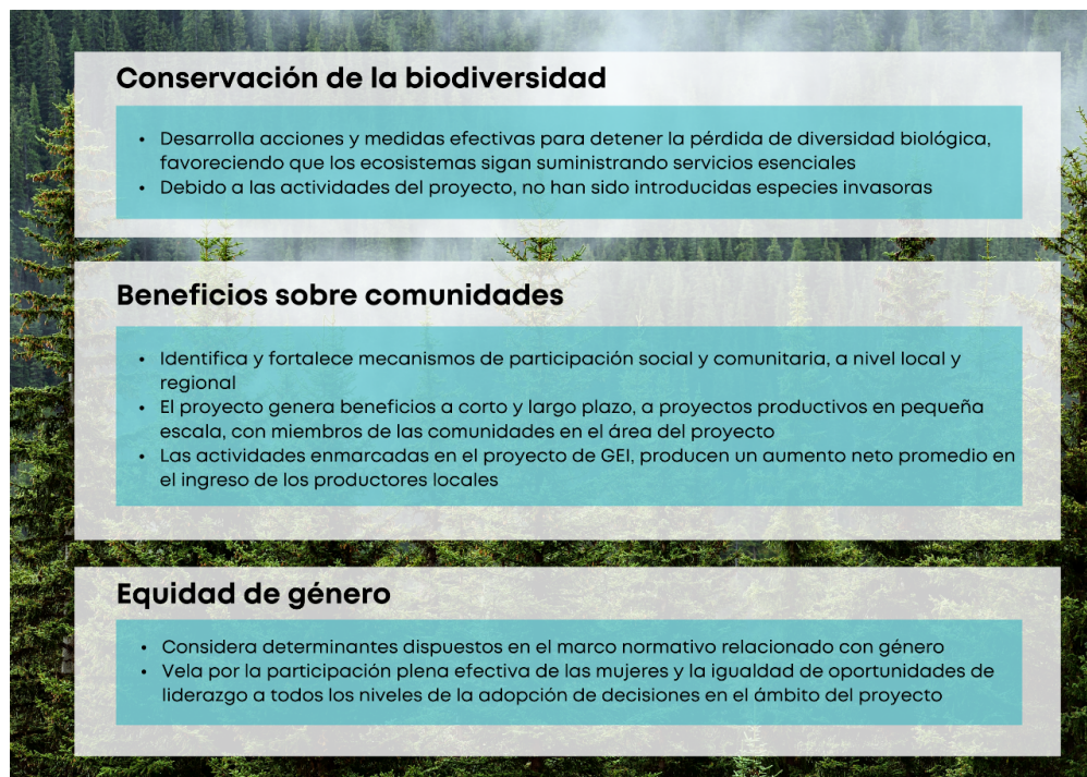
Ilustración 1. Requisitos de la categoría Orquídea

Las orquídeas son el grupo de plantas con flores más diverso y evolucionado del planeta, con cerca de 25.000 a 30.000 especies en el mundo, de las cuales 4.270 son nativas de Colombia y 1.572 son endémicas. Los requisitos para obtener la Categoría Orquídea se presentan en la Ilustración 1.