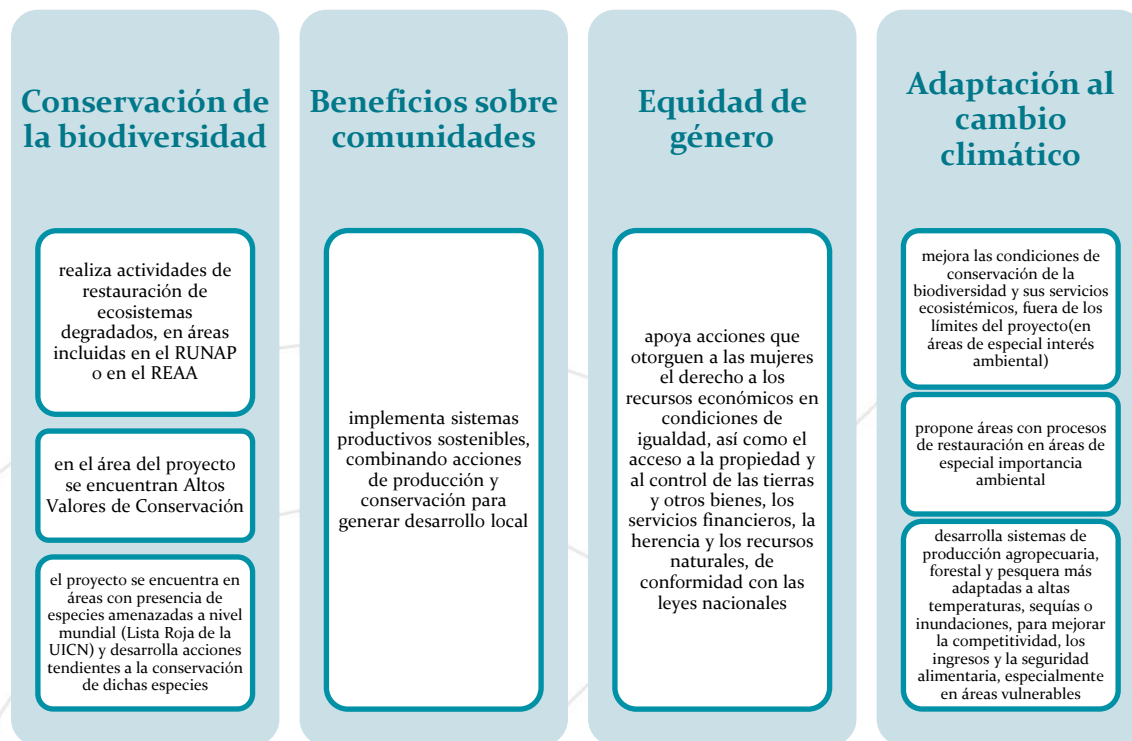
Ilustración 2. Requisitos de la categoría Palma de cera

La palma de cera ( Ceroxylon quindiuense ) crece en uno de los ecosistemas más amenazados en el mundo, los Bosques de niebla tropicales. Los palmares de Ceroxylon quindiuense constituyen uno de los paisajes más espectaculares de los Andes colombianos. A pesar de representar el árbol nacional de Colombia, la especie fue categorizada como en peligro (EN) por Galeano & Bernal (2005), pues, aunque aún quedan grandes poblaciones en algunos sectores de la cordillera central, su hábitat se ha reducido considerablemente y se estima que sus poblaciones han disminuido en más del 50% en las últimas tres generaciones (210 años). 38 Los requisitos para obtener la Categoría Palma de cera se presentan en la Ilustración 2.