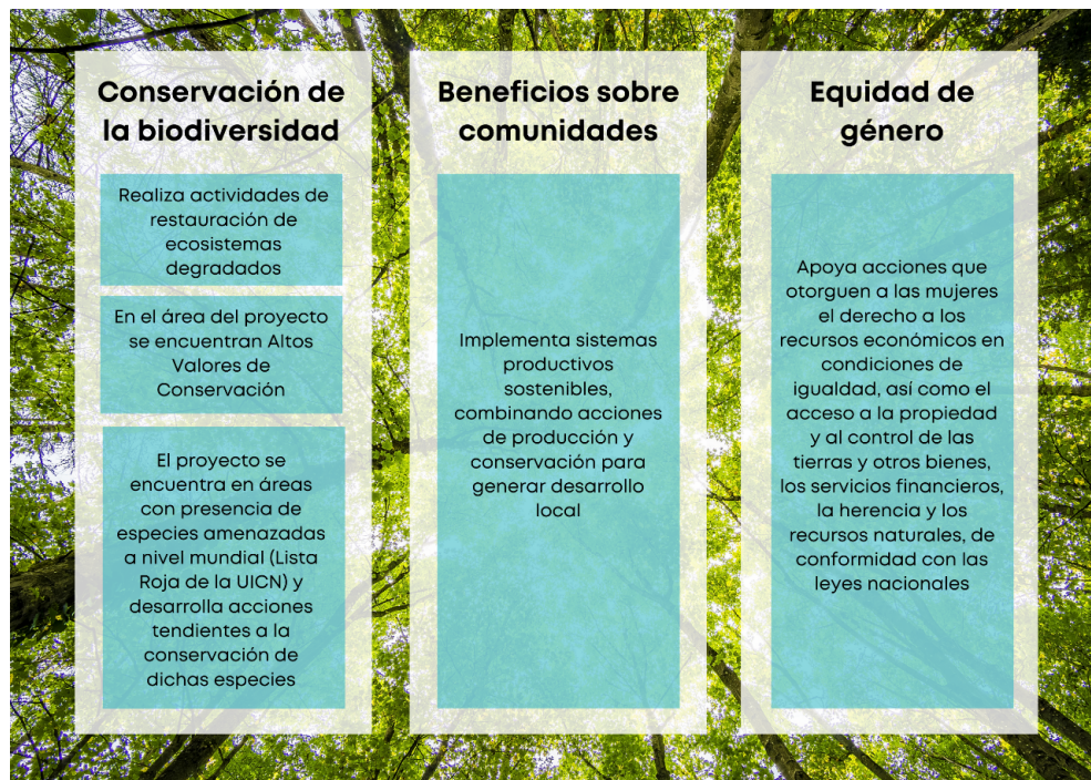
Ilustración 2. Requisitos de la categoría Palma de cera

La palma de cera ( Ceroxylon quindiuense ) crece en uno de los ecosistemas más amenazados en el mundo, los Bosques de niebla tropicales. Los palmares de Ceroxylon quindiuense constituyen uno de los paisajes más espectaculares de los Andes colombianos. A pesar de representar el árbol nacional de Colombia, la especie fue categorizada como en peligro (EN) por Galeano & Bernal (2005), pues, aunque aún quedan grandes poblaciones en algunos sectores de la cordillera central, su hábitat se ha reducido considerablemente y se estima que sus poblaciones han disminuido en más del 50% en las últimas tres generaciones (210 años). 32 Los requisitos para obtener la Categoría Palma de cera se presentan en la Ilustración 2.